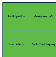
Stärkung der Selbsthilfe