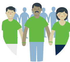
Förderung von ehrenamtlichem Engagement