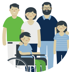
Begleitung der Familien zu Hause