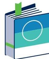
Bundesweite Fachorganisation und politische Interessensvertretung