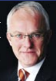
Ministerpräsident Jürgen Rüttgers

Das 2. Deutsche Kinderhospizforum wird unterstützt von der Else Kröner-Fresenius-Stiftung, Ladies' Circle Deutschland, den DEVK Versicherungen und der Sparda-Bank West eG.