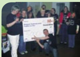
Tina Turner Revival Show

An dieser Stelle möchten wir dem Rochusclub zu seinem 30-jährigen Bestehen gratulieren und uns für sein Engagement ganz besonders bedanken.