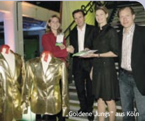
„Goldene Jungs“ aus Köln