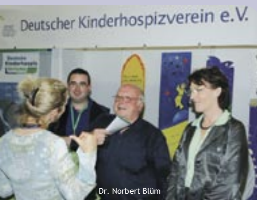
Dr. Norbert Blüm