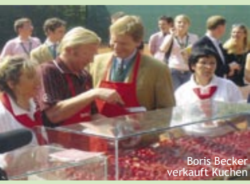
Boris Becker verkauft Kuchen

Die NORDholding Unternehmensbeteiligungsgesellschaft mbH aus Hannover unterstützt mit der stolzen Spendensumme von 10.000 EUR unseren ambulanten Kinderhospizdienst in Hannover, den wir seit Januar 2005 in Kooperation mit dem Arbeiter-Samariterbund aus Hannover betreiben.