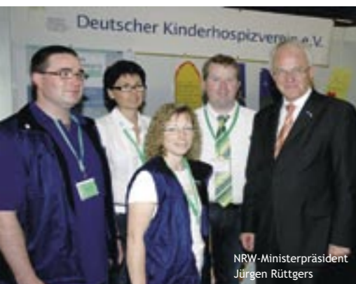
NRW-Ministerpräsident Jürgen Rüttgers

Wir benötigen auch in Zukunft, weitere Unterstützung, damit sich die Kinderhospizarbeit lebendig weiterentwickeln kann, die Familien kräftig und gestärkt ihren eigenen Lebensweg gehen und das Bewusstsein unserer Mitmenschen für das Wesentliche im Sinne der erkrankten Kinder schärfer wird.