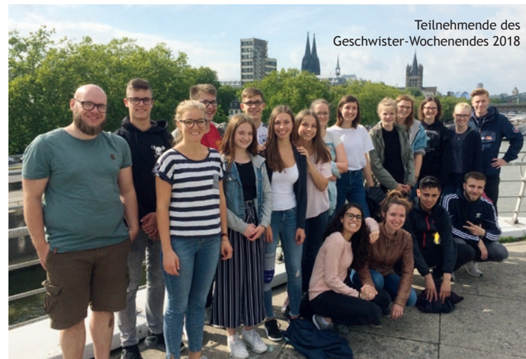
Teilnehmende des Geschwister-Wochenendes 2018