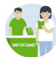
Öffentlichkeitsarbeit für Kinder- und Jugendhospizarbeit