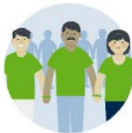
Förderung von ehrenamtlichem Engagement