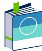
Bundesweite Fachorganisation und politische Interessensvertretung