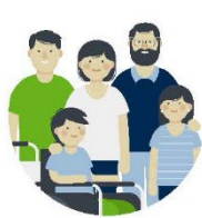
Begleitung der Familien zu Hause