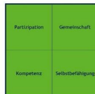
Stärkung der Selbsthilfe