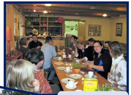
Familien-Café 2008 und Treffen 2014