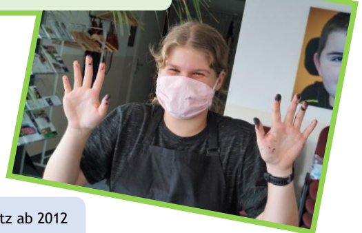
Ehrenamtstreffen am Fetscherplatz ab 2012 und per Zoom 2021