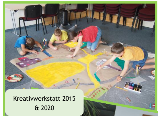
Kreativwerkstatt 2015 & 2020