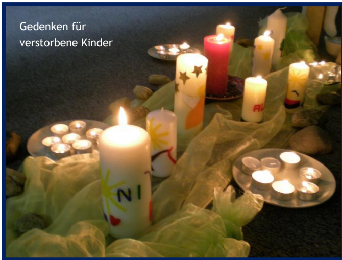
Gedenken für verstorbene Kinder