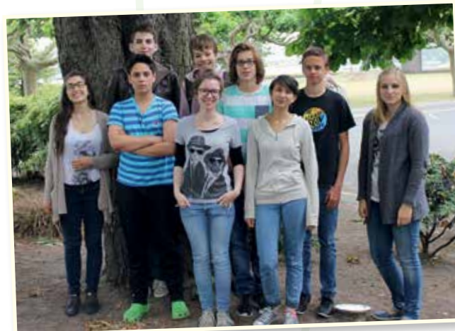
Teilnehmende des Geschwister-Workshops beim Deutschen Kinderhospizforum 2015